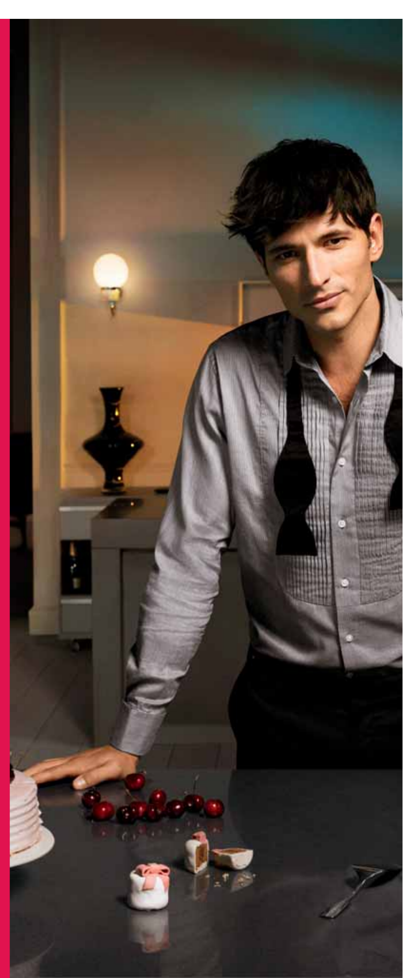
Andrés Velencoso. Top Model International